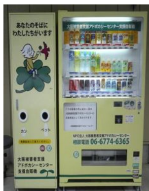
オリジナルデザイン型