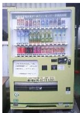
ステッカー貼付型